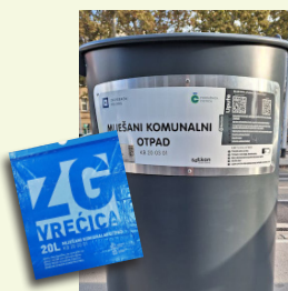
MIJEŠANI KOMUNALNI OTPAD

Odlaze se u ZG vrećicu samo ono što nije korisni otpad: vrećice iz usisavača, higijenski papir, vlažne maramice, zaprljani ili premazani voštani papir (npr. papirnati ubrusi, papir iz mesnice, papir za pečenje kolača), računi iz dućana od termo papira, ostaci termički obrađene hrane (meso, riba, kuhano povrće) i kosti, manje igračke, opušci, britvice za brijanje, izmet i pijesak za kućne životinje.