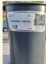
PLASTIKA / METAL

Odlazu se suhe i čiste novine, časopisi, prospekti, katalogi, bilježnice, mape i fascikli, kalendari, papirna – kartonska ambalaža.